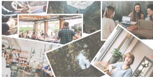
Zoeken in de fotobibliotheek

Let op! foto's die je van het internet haalt zijn vaak auteursrechtelijk beschermd. Deze foto's mogen niet op deze website geplaatst worden.